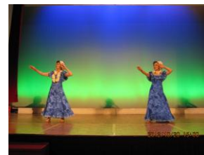
ハワイのフラダンス